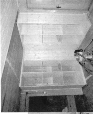
Schrank und Ablage im OG