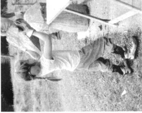
nächste Generation beim Holzspalten